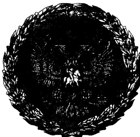
РИСУНОК НАГРУДНОГО ЗНАКА К ПОЧЕТНОЙ ГРАМОТЕ ПРЕЗИДЕНТА РОССИЙСКОЙ ФЕДЕРАЦИИ

Утвержден Указом Президента Российской Федерации от 11 апреля 2008 г. N 487